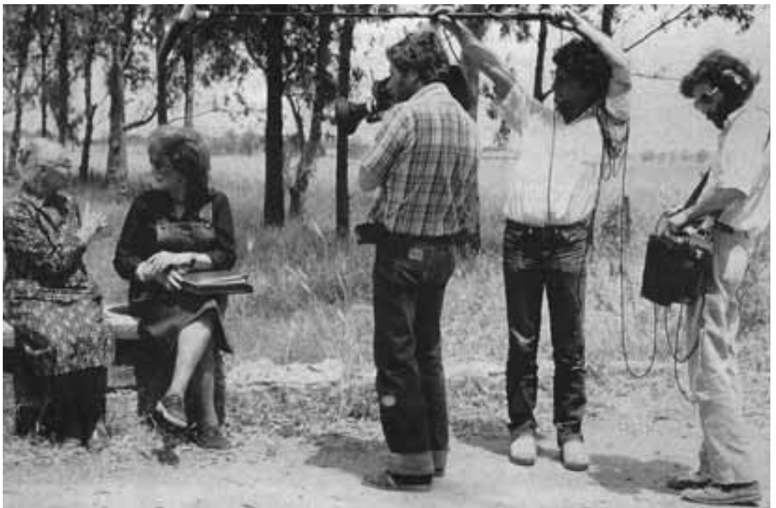
Una discendente dei romagnoli ostiensi racconta le tecniche di raccolta della legna nel ravennate alla fine dell'Ottocento