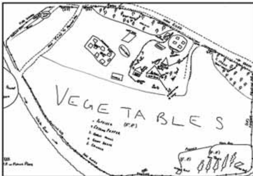
Mappa di comunità disegnata dal gruppo degli uomini di Sitama Impilo (provincia di Mpumalanga - Sud Africa) nell'ambito di un progetto internazionale a sostegno della redistribuzione delle risorse naturali nel post-apartheid